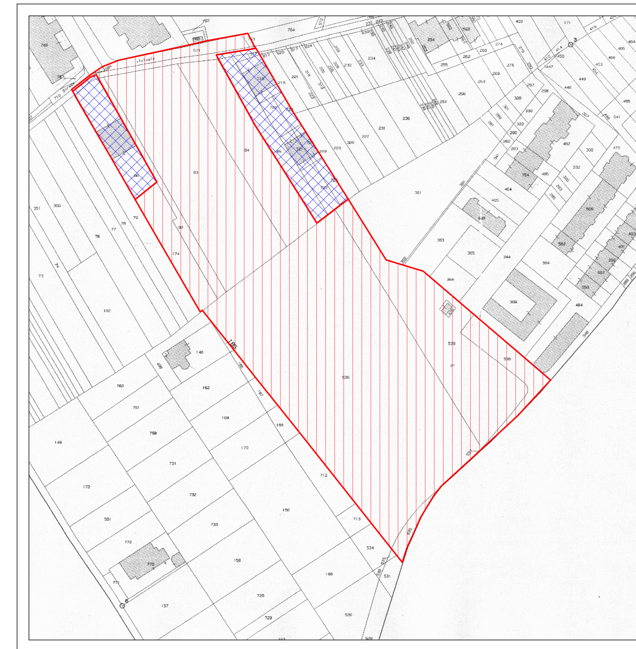
STRALCIO CATASTALE AGGIORNATO SCALA 1:1000 N.C.T. Fg. 28 Mappale 82-83-174-476-535-536-537 N.C.T. Fg. 28 Mappale 538-539-564-571-763