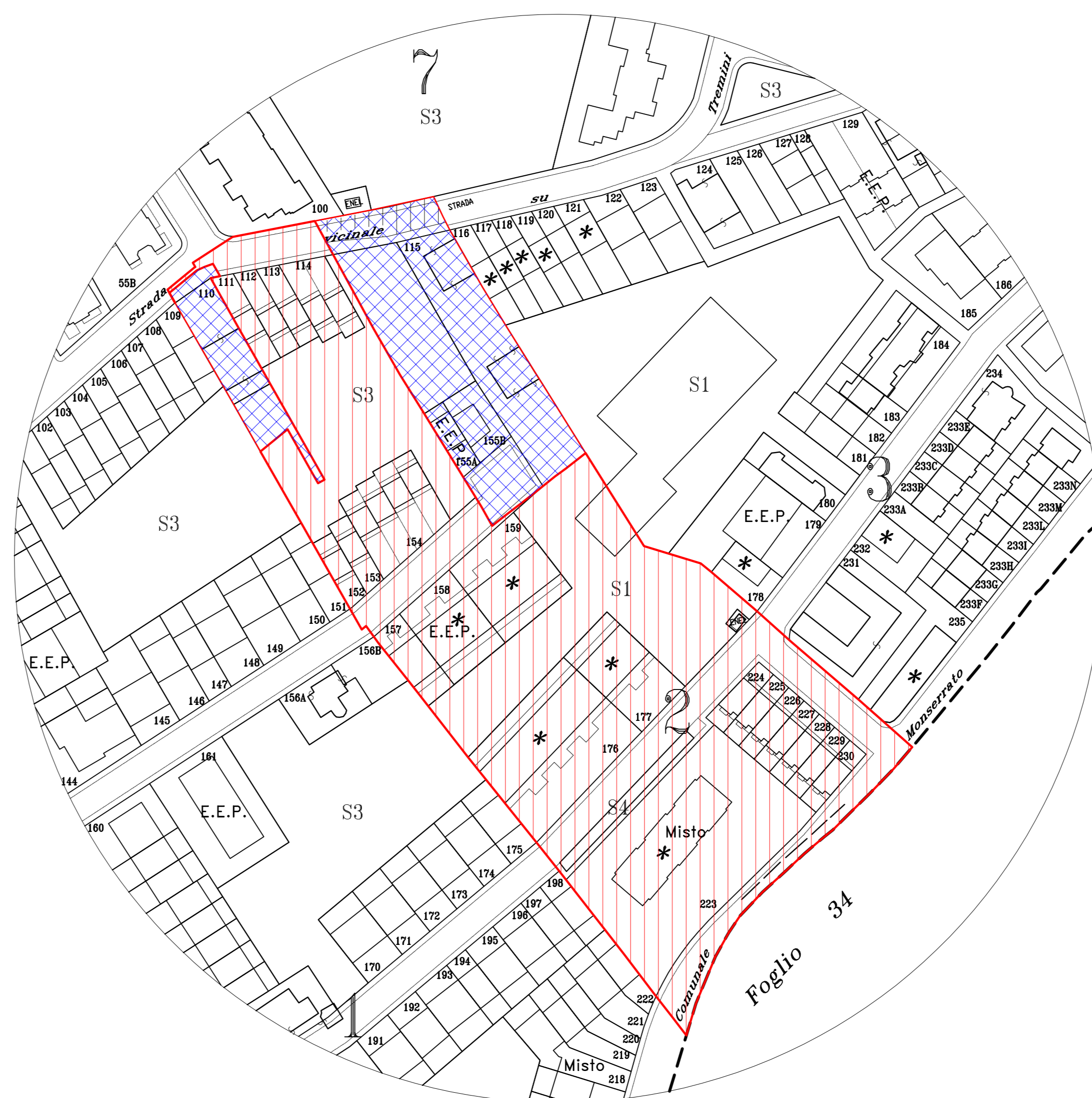
STRALCIO P.R.U. APPROVATO SCALA 1:1000