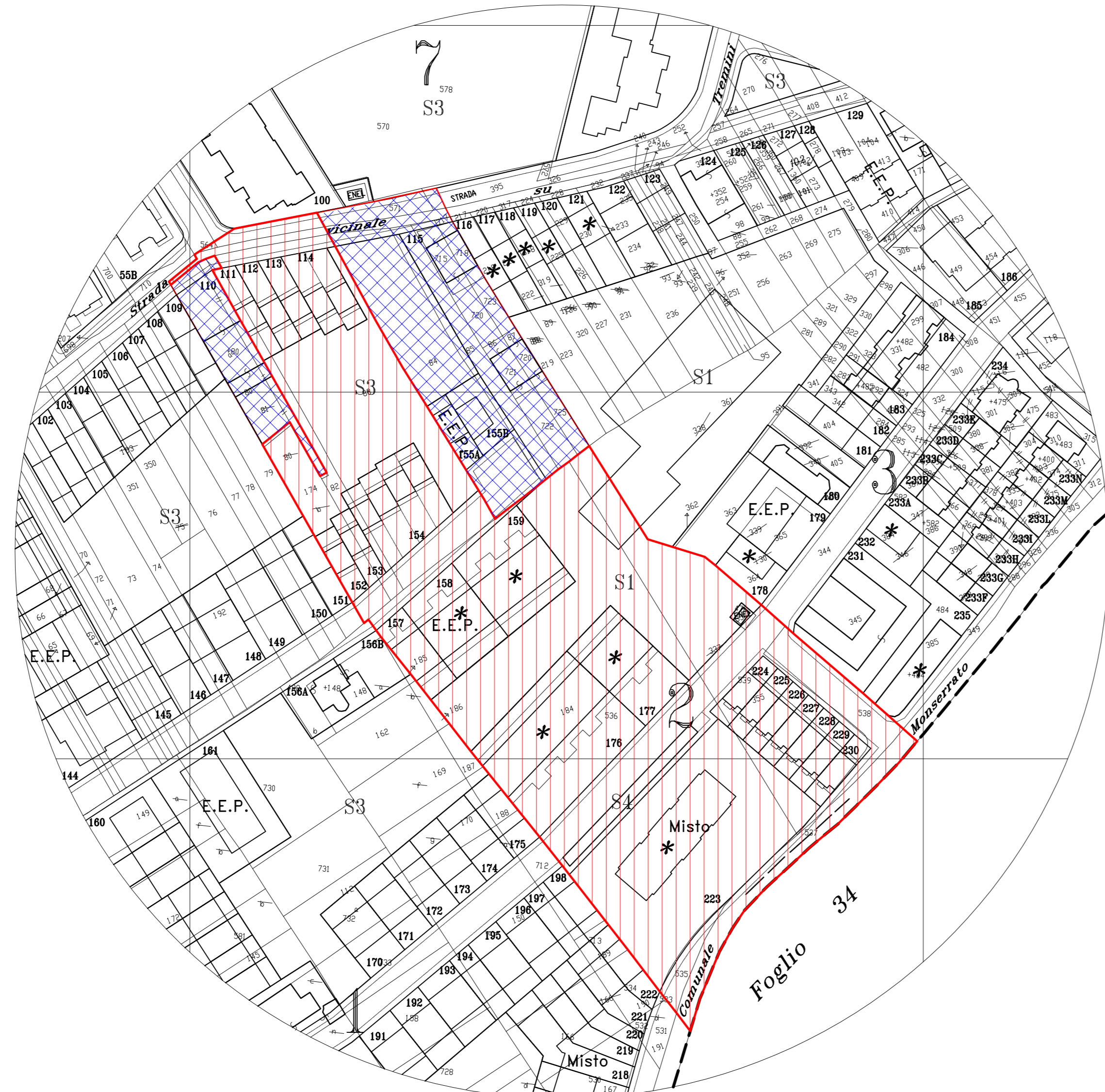
STRALCIO P.R.U. APPROVATO GEOREFERENZIATO SOVRAPPOSTO CON IL CATASTALE SCALA 1:1000